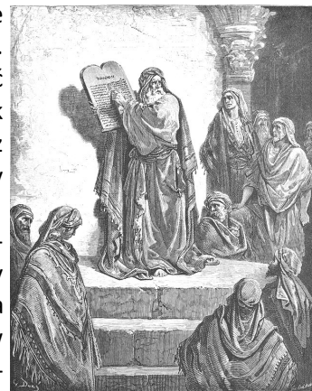
Gustave Dore: „Ezdrasz od- czytujący prawo ludowi” [Ne 8,1-12]

Jak już wspomnieliśmy głównym tematem Ksiąg Edrasza i Nehemiasza jest odbudowa świątyni i oparcie życia narodu wybranego o liturgię w świątyni sprawowaną. Jednak księgi te zawierają jeszcze inne ważne tematy. Drugim z nich jest rola świętego miasta Jerozolimy. Po wojnach, które doprowadziły do niewoli babilońskiej Izraela, Jerozolima leżała w gruzach. Powracający po 70 latach Żydzi wprawdzie bardzo tęsknili za swą dawną stolicą, jednak zobaczywszy jej stan nie mieli ochoty w niej zamieszkać. Z Babilonii wracali ludzie, którzy urodzili się w ziemi niewoli. W Babilonii przywykli oni do mieszkania na żyznej równinie i perspektywa życia w górach i półpustynnych warunkach nie bardzo im odpowiadała. Wydawało się, że miasto nie zostanie odbudowane, bo nie będzie dla kogo. Wielkiego wysiłku od przywódców, Edrasza i Nehemiasza, wymagało przekonanie repatriantów, aby zaludniali święte miasto Jeruzalem a nie wybierali wygodniejszego życia w żyznych dolinach nad Morzem lub w Galilei.